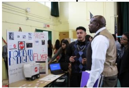
Experiencia de negocios