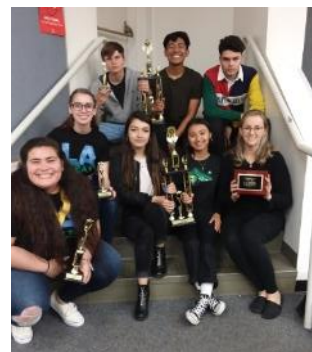
Equipo ganador del premio Debate