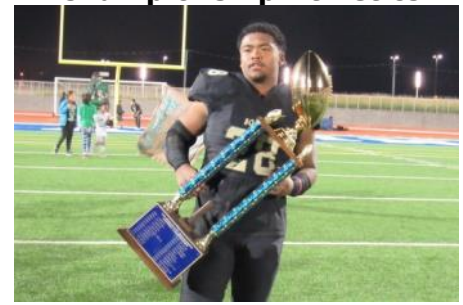
Campeonato de atletismo