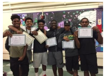
Atletas estudiantes de College Bound