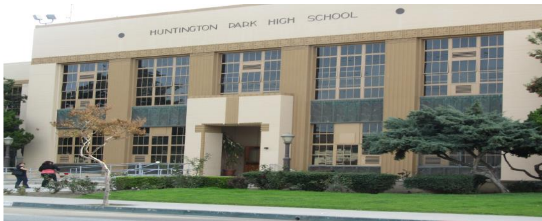
Huntington Park High School