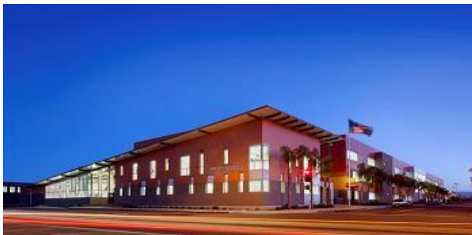
Linda E. Márquez High School

Portafolio de Opciones de Escuelas Preparatorias