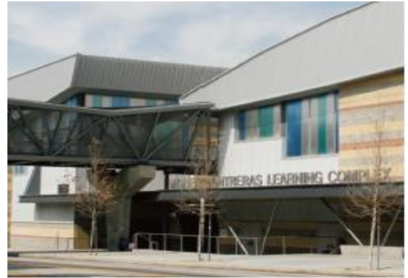
Contreras Learning Complex