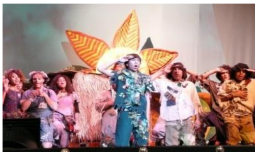
Academia de Teatro