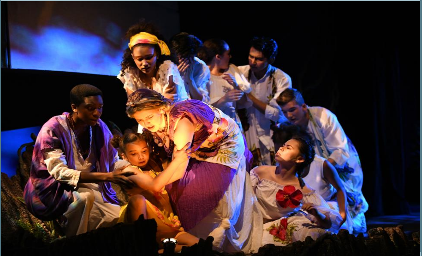
Preparatoria Ramón C. Cortines Escuela de Artes Visuales y Escénicas