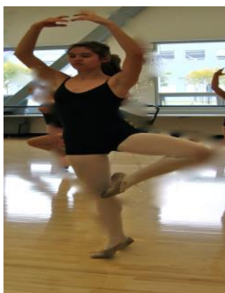
Academia de Danza