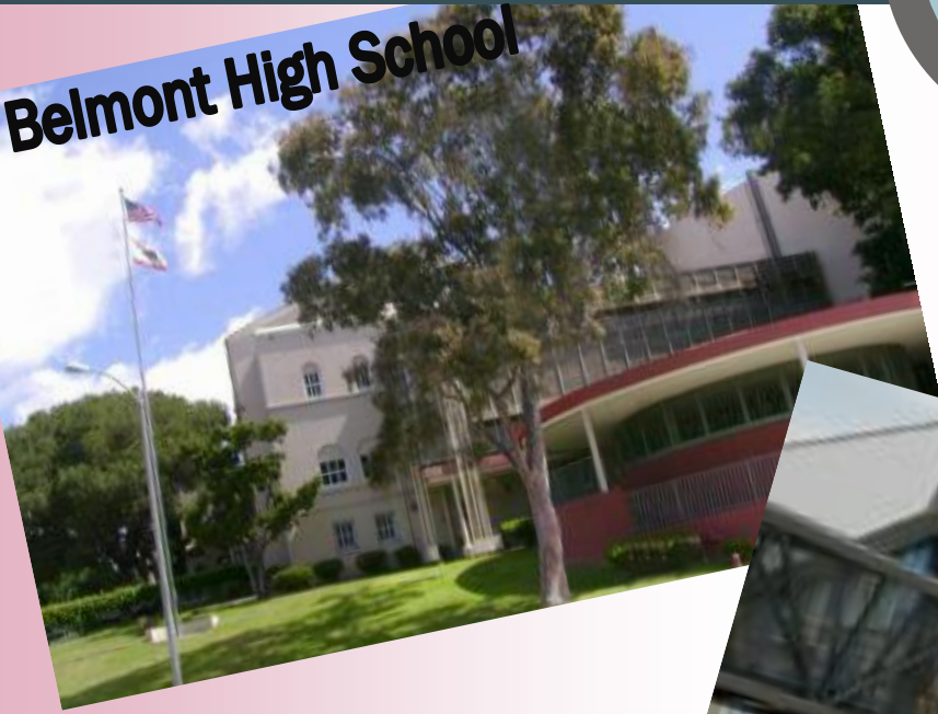
Belmont High School