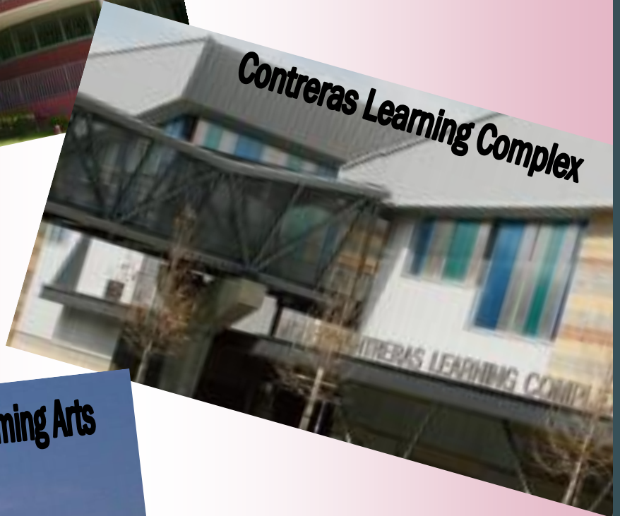
Contreras Learning Complex