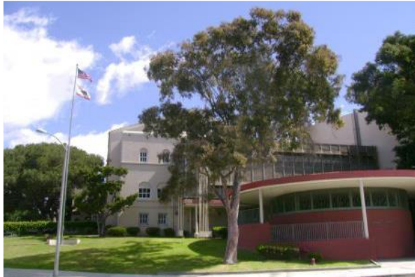
Belmont High School