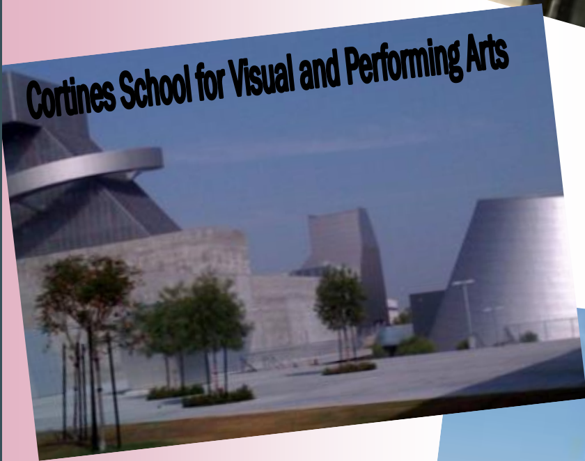
Cortines School for Visual and Performing Arts