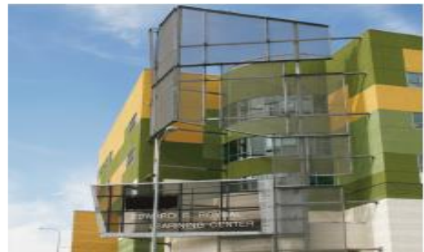
Roybal Learning Center