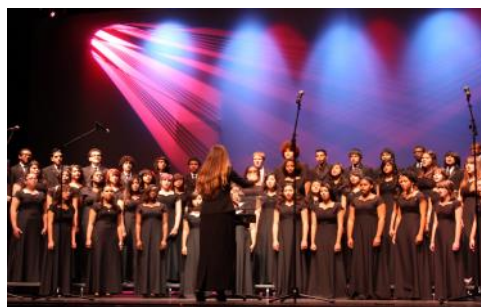
Academia de Música