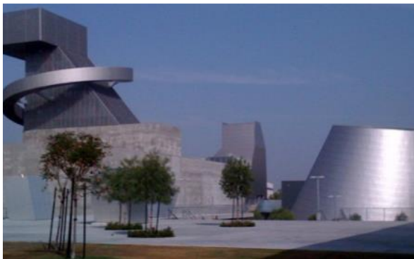
Cortines School for Visual and Performing Arts

Portafolio de Opciones de Escuelas Preparatorias