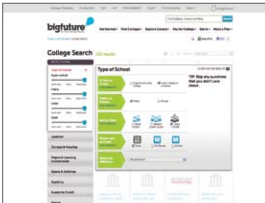
Busque y compare universidades.

Para obtener una guía experta y gratuita para ayudar al estudiante a entrar a la universidad, visite bigfuture.org